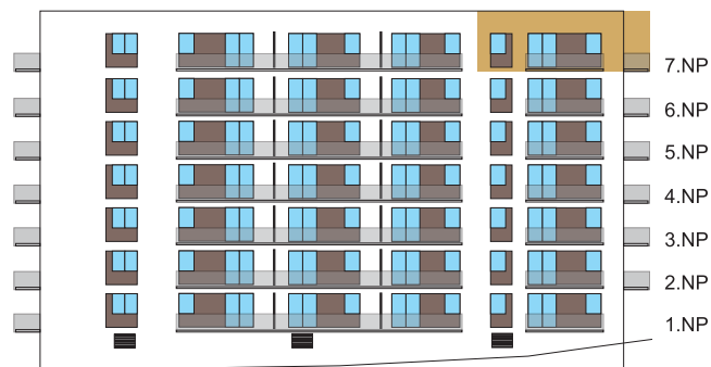
Západní pohled na dům/ Building View - West side